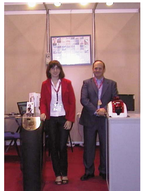
El stand de Sport & Consulting en la feria de Valencia.

Asimismo, la empresa pretende ampliar su gama de productos. Por el momento, ha comenzado a distribuir unos brazaletes de silicona que combinan estética y funcionalidad ya que, por ejemplo, posibilitan a los usuarios bañarse con ellos. También incorporan un versátil sistema de lectura-escritura que permite usarlos como monedero o gestor de taquillas.