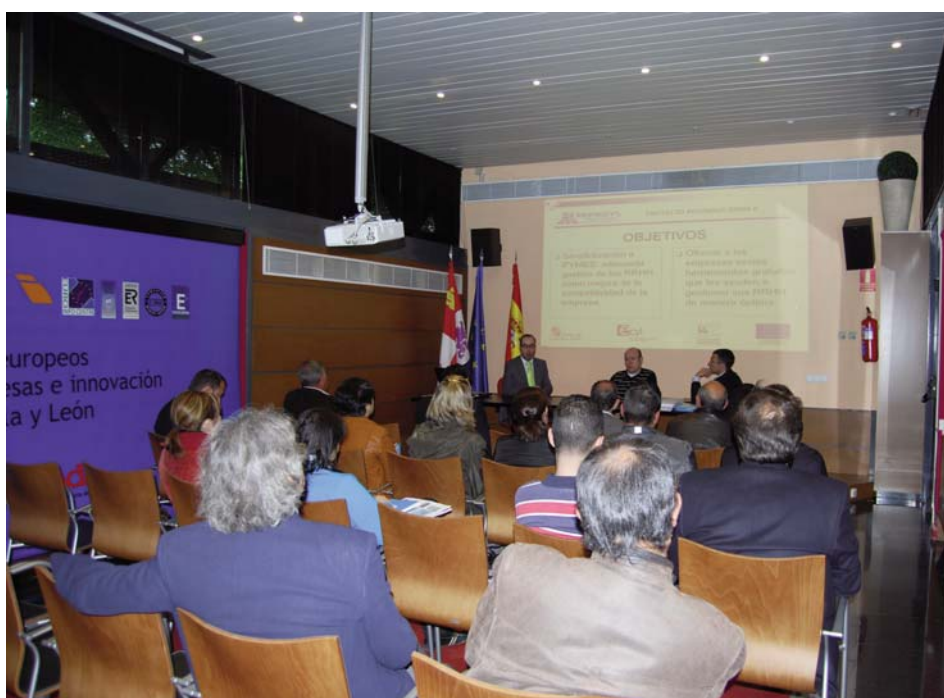
Asistentes a la jornada de presentación del programa Polindus RRHH en el salón de conferencias de CEEICAL, en el mismo edificio donde se encuentra la sede de la Asociación de Propietarios del Polígono Industrial de León. Además de este programa de gestión de personal, tuvieron la oportunidad de conocer la nueva convocatoria de ayudas de la ADE.

Con los resultados del programa las empresas pueden diseñar planes de actuación adaptados a sus necesidades