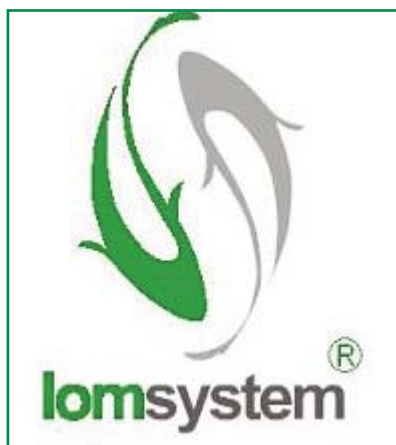
Logo de la nueva empresa de CEEI Edificio León.