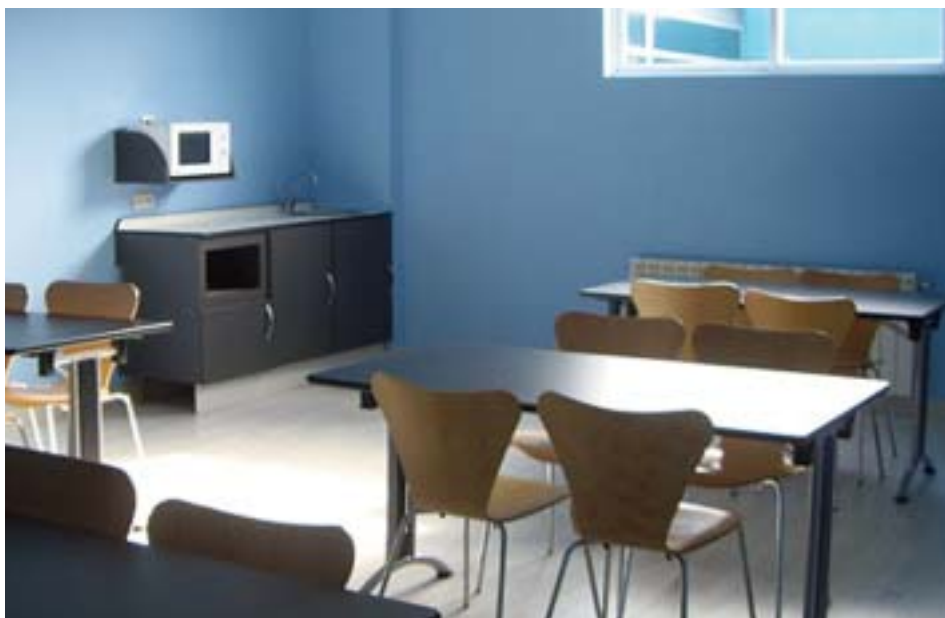
El nuevo comedor de CEEI Edificio León, operativo en el módulo 2.12, cuenta con varias sillas y mesas, además de con un microondas para calentar la comida y una pila de agua para lavar los cacharros.

La sala se encuentra perfectamente acondicionada, con aire acondicionado para los meses