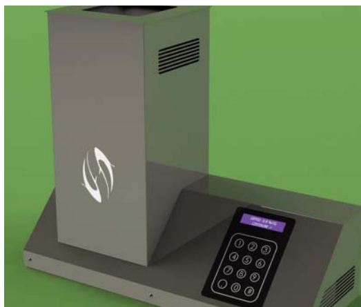
Diseño virtual de uno de los prototipos ofrecidos por Lomsystem.